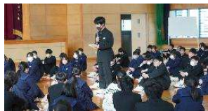
激励を伝える2年生,1年生代表