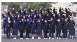
発表後に緊張から開放されさわやかな爽やかな表情で記念撮影をする1年生

1月18日（土）宝山ホールで行なわれました第58回 鹿児島県中学校音楽コンクール「春の祭典」に三笠中学校代表として1年生が出場しました。県内の中学校が集う大舞台での経験は大変貴重な経験になったことだと思います。1年生のみなさんお疲れ様でした。